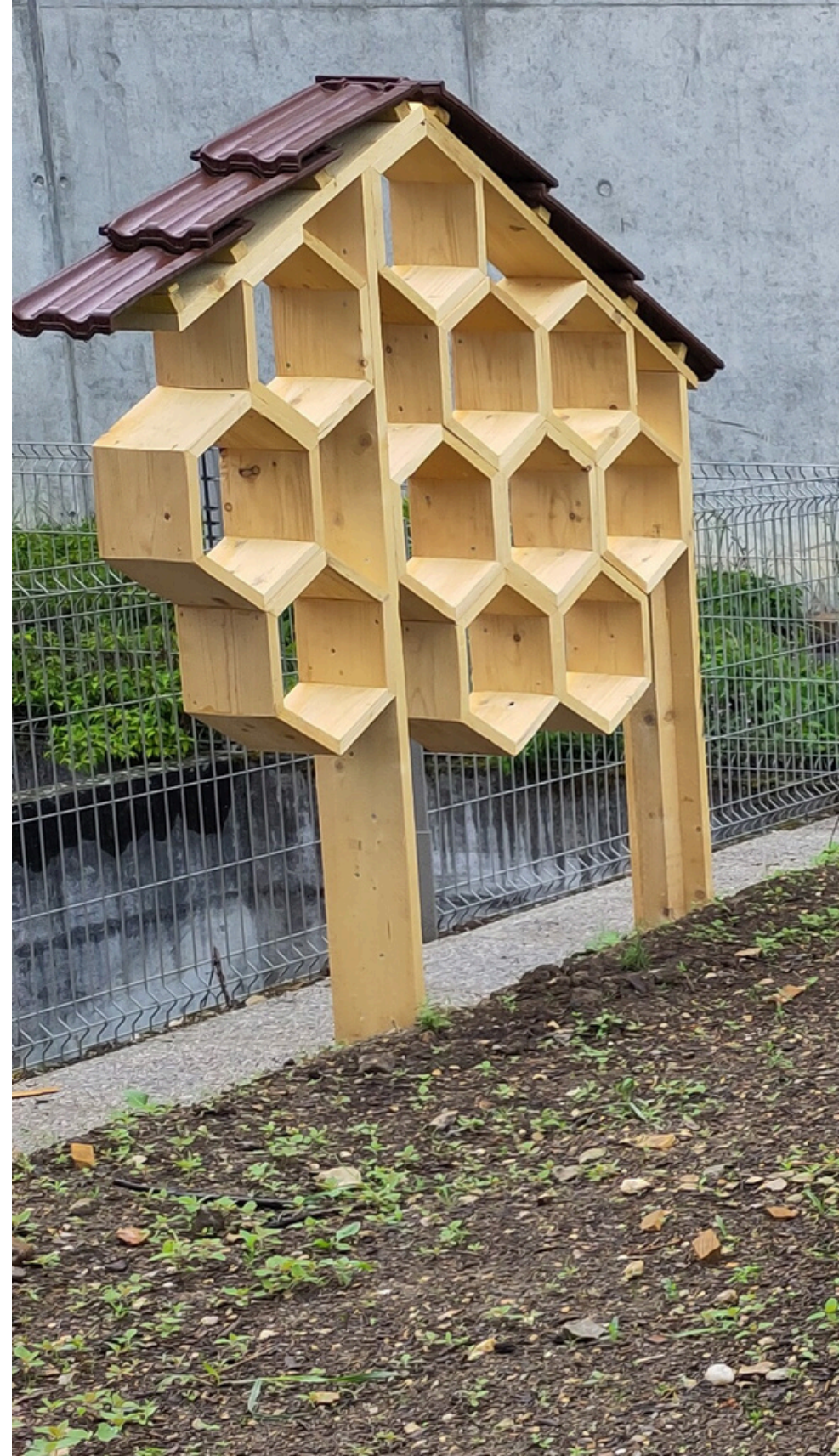
L'hôtel à insectes à garnir